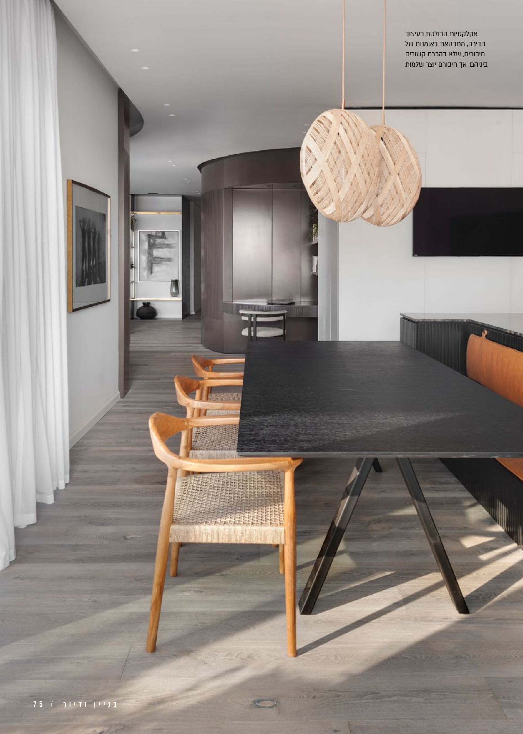
אקלקטיות הבולטת בעיצוב הדירה, מתבטאת באומנות של חיבורים, שלא בהכרח קשורים ביניהם, אך חיבורם יוצר שלמות